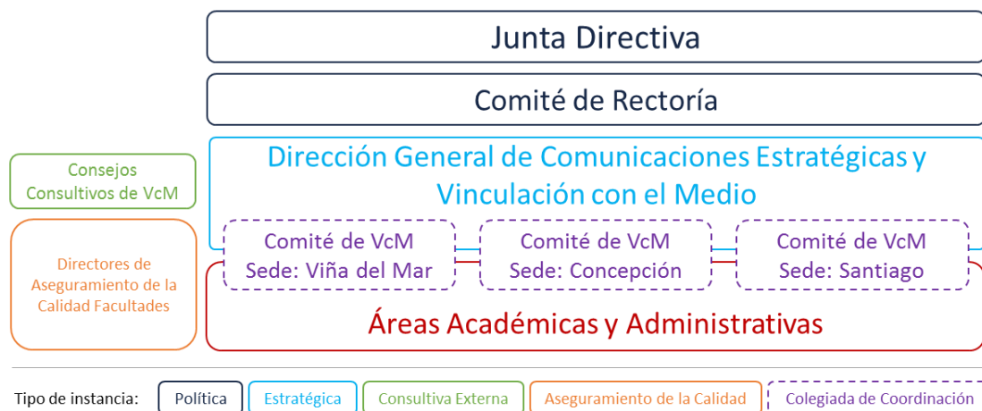
Fig. Estructura de Coordinación de la Vinculación con el Medio a nivel institucional

Para gestionar la Vinculación con el Medio, en la Universidad existen diferentes unidades con roles bien definidos, todas ellas coherentes con la misión, el plan estratégico institucional y el Reglamento General, las que se coordinan tanto a nivel nacional como regional para apoyar al logro de los objetivos institucionales.